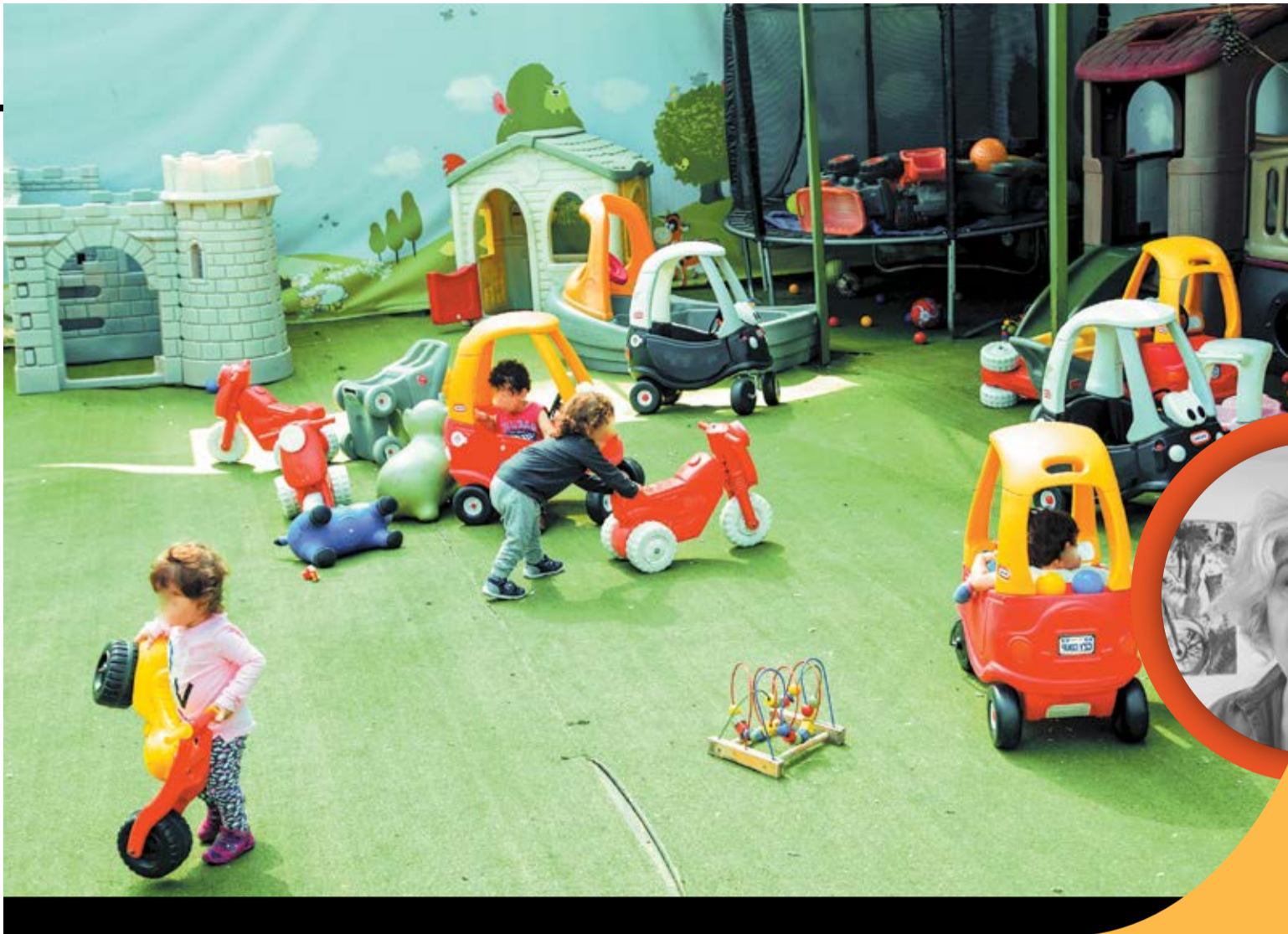
צילום: תמרה שי - מלאכה 90