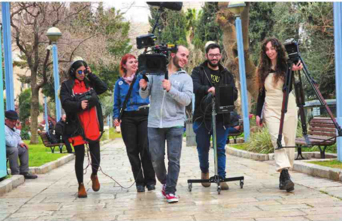
הרבה כבוד והכלה הודית. סטודנטים לקולנוע במעלה