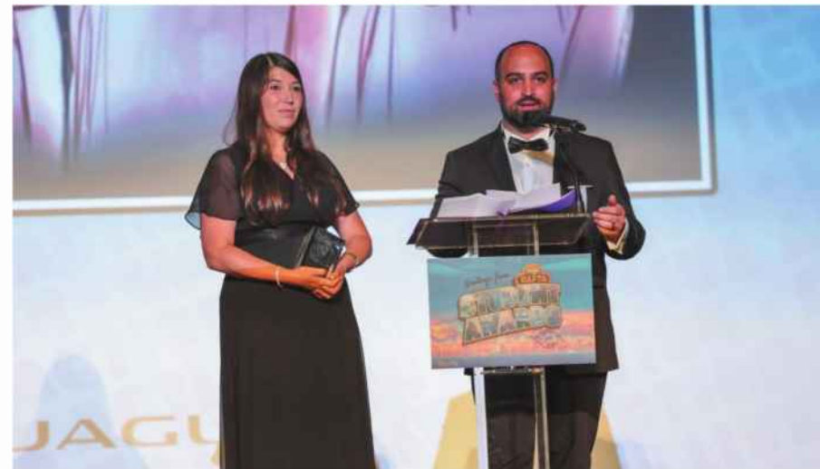
סרט סטודנטים שעשוי טוב. הזכייה בבאפט"א

"כשמגיעים לקונפליקט, זה מעניין ונוצרת אנרגיה מעניינת. לפני חודש ערכנו יום עיון שעסק בשאלות הנוגעות לאמנות וגבולות, ומה שראינו הוא שאמנות חייבת גבולות, זה היה קיים מאז ומעולם. השאלה היא איך בתוך הגבולות אפשר להיות דתיים, הלכתיים או פוליטיים. לפעמים זה לא עניין של אידיאולוגיות אלא בכלל שאלות שנוגעות לעניינים טכניים כביכול, אורך הסרט ומסגרת התקציב.